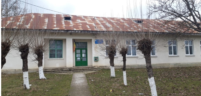
Inainte de renovare