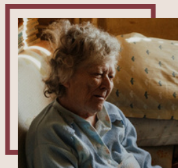
Asistența socială a vârstnicilor: „Bunicii - semenii noștri”