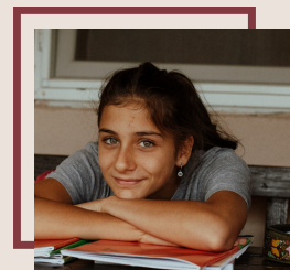
Casa Familială „a-mic”

Unul din cele mai mari și longevive proiecte ale Organizației, oferă sprijin unui număr de 200 de familii anual în 4 localități - Cluj-Napoca (și sate din vecinătate), Zalău, Șimleu Silvaniei și Târgu Jiu.