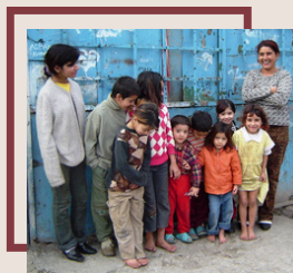
Asistența Socială a Familiilor aflate în Criză