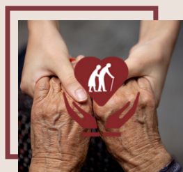
„AVUS” - Asistența la domiciliu a vârstnicului

Este „acasă” pentru 11 copii care locuiesc în permanență la noi și sunt sprijiniți în drumul lor spre găsirea propriei identități.